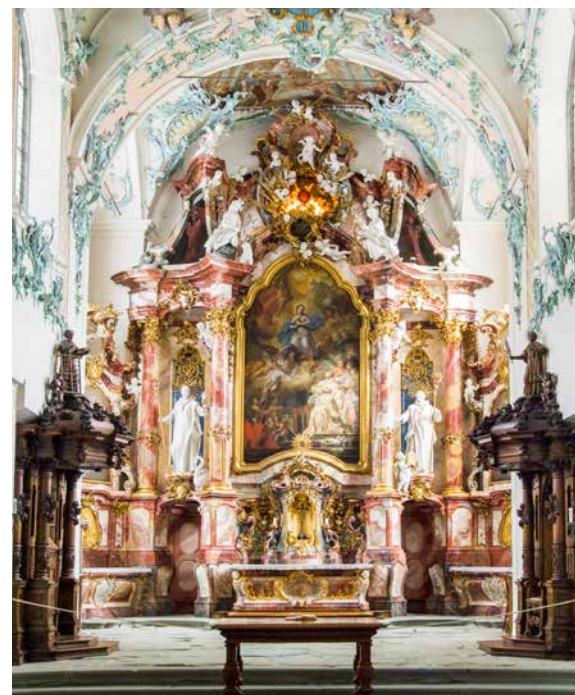
Blick in die barocke Kirche der Kartause Ittingen

Reservation: info@kartause.ch, +41 (0) 52 748 44 11